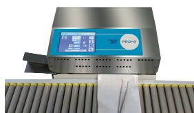
TS 46N avec Convoyeur à rouleaux