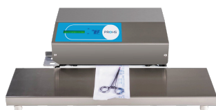
TS 45DN avec Plateau