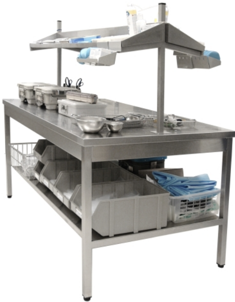
Mesa de preparación – dos puestos 2000 x 850 x 900mm