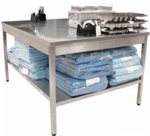
Mesa de preparación simples 2000 x 1000 x 900mm