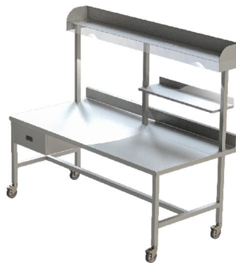
Mesa de preparación – un puesto 1500 x 700 x 900mm

Debido al desarrollo de producto, PROHS reserva el derecho a hacer cambios sin previo aviso.