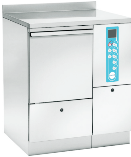
Dim. (AnchoxProf.xAlto mm): 750x600x850