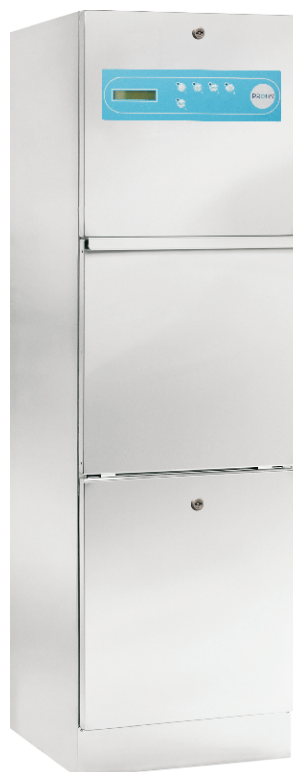
Dim. (An.xProf.xAl. mm): 450x500x1500

Pequeña cesta que permite el lavado y desinfección de los utensilios.