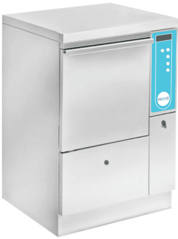
Dim. (AnchoxProf.xAlto mm): 600x600x900