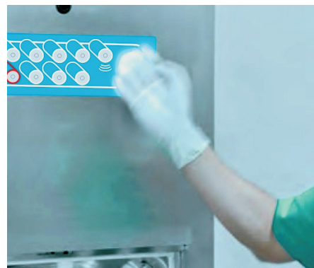
Sensor óptico en el panel.