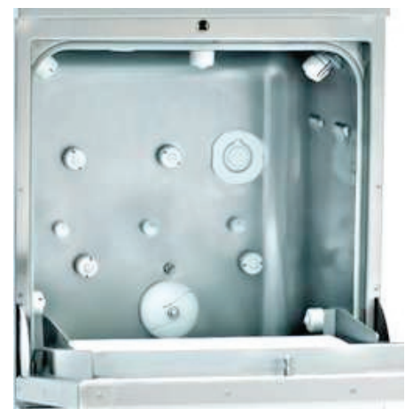
Detalle Cámara de Lavado