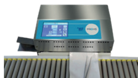
TS 46T com Tabuleiro de Rolos (opção)