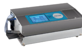
TS 47T com Armazenamento USB (opção)