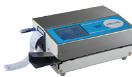
TS 46T com Armazenamento USB (opção)